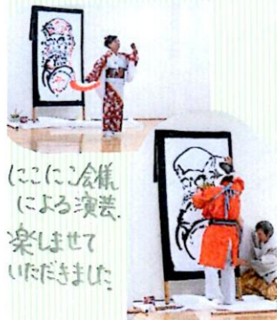
にこにこ会様による演芸、楽しませていただきました。