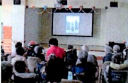
スライドショーもありました。