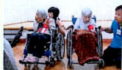
最長寿のお二人です。

秋の気配を感じ始めた、9月15日敬老会を行いました。入居者の長寿をお祝いし、最長寿、米寿、卒寿の方々へ、記念品を贈呈しました。また、にこにこ会様による演芸で書道吟、踊りが披露され、大きな拍手が起こっていました。