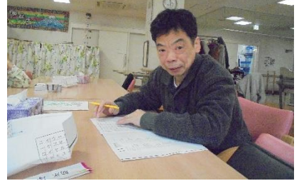
勉強しています。ホントに…