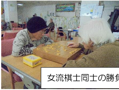
女流棋士同士の勝負