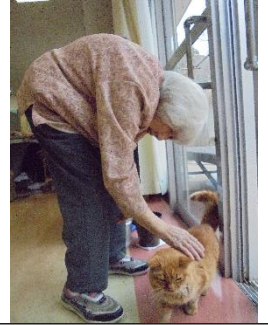
皆様に可愛いがられてます。 猫名：ちょぼ