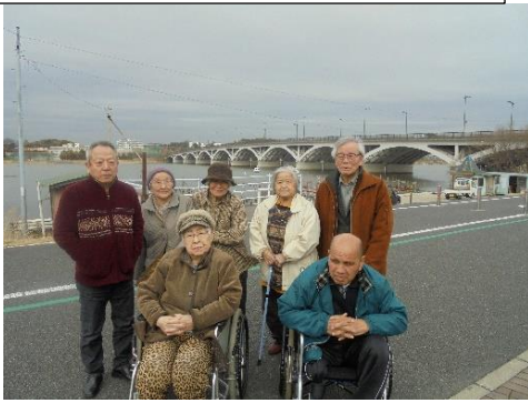
道の駅までドライブ。ちょい寒!