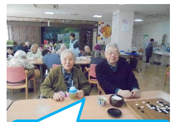
高柳仲良しツーショット