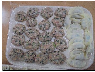
残った具はハンバーグ