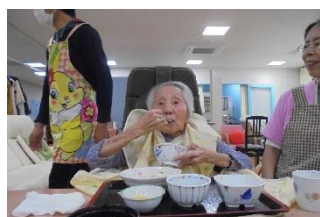
美味しく頂いてます！