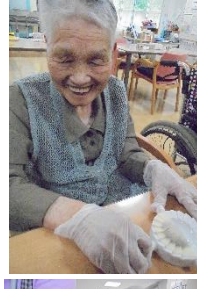
餃子作り器で簡単かんたん！